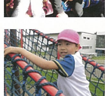
おやつ タイムです。