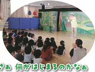
さあ 何がはじまるのかなあ