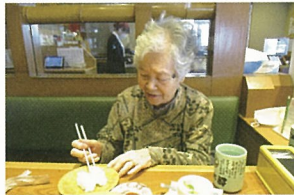
ステーキよりお寿司

5月から、待ちに待った外出行事が始まりました。世の中は行動制限が緩和され、マスクなしの方々も多くみられますが、デイサービスでは引き続き、感染予防対策をしっかりと、少人数での外出を楽しみたいと思っています。 またセンター内では、身体と頭を使った楽しいレクや、園児交流会も始まりました。やっぱり子どもさんたちの元気な声を聞くと、自然と笑顔もこぼれ元気になりますね。