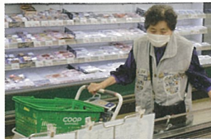
いろいろあって楽しい