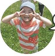
遠足とっても 楽しかったよ!

6月18日(火)、こあら組 とぞう組のお友達がバスに 乗って、木古内ふるさとの 森公園に遠足に行っていま した。子ども達が願いを込 めて作ったてるてる坊主の おかげで天候にも恵まれ、 青空の下、遊具で遊んだり、 みんなでお弁当を食べ、笑 顔いっぱい楽しい一日を 過ごしました。