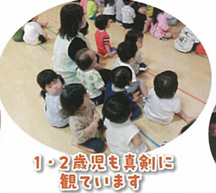
1・2歳児も真剣に 観ています