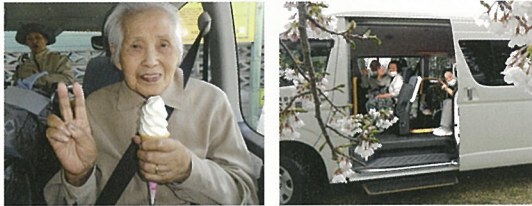
今年はちょっと桜が寂しかったですが春の陽気を楽しみソフトクリームは相変わらずの美味しさでした!