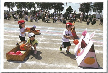
うさぎさんのお口に みかんを入れてね (2才児)