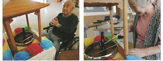
お釈迦様の誕生日に甘茶をかけてお祝いしました!