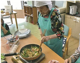
やりたい事を一緒にやりましょう!