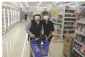
感染対策バッチリ