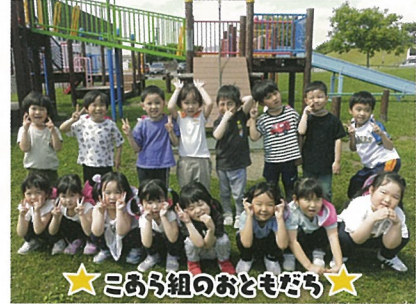
★みみ組のおともだち★