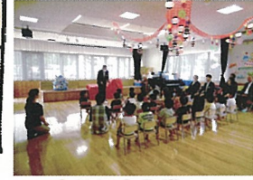
森林組合長様より ご挨拶を頂きました

はこだて広域森林組合様より、 木製玩具を寄贈して頂きました。 贈呈式には森林組合長様をはじめ、 当法人理事長、北斗市農林課長様他、 たくさんの方にご臨席頂きました。子 ども達はちょっぴり緊張した面持ち でしたが、たくさんの方の木製玩具のお披 露目では、歓声を上げて大変喜んでお りました。また式では、30年40年50年 と長い年月をかけて育った木が、様々 な物に形を変えて私たちの生活に取 り入れられている事や、大切に使う事 を学ばせて頂きました。 頂いた木製玩具を通して、木の感触 やぬくもりを子ども達が感じられる ように働きかけながら、楽しく遊ばせ て頂こうと思います。