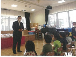
当法人理事長さんより ご挨拶を頂きました