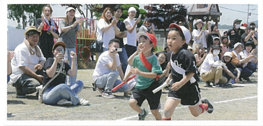
紅白リレー (5才児アンカー)