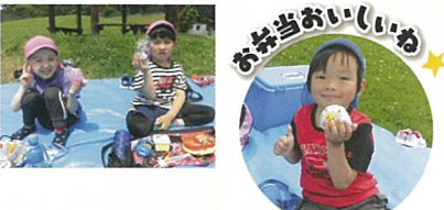
お弁当おいしいね