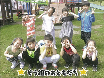
★ぞう組のおともだち★