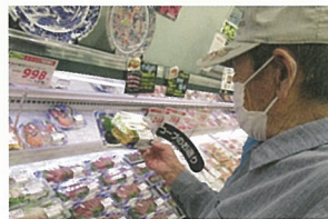
今晚のおつまみです