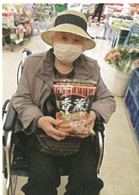
たくさん買いました! 今度はどこに行きましようかね~♪