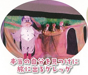
本当の自分を見つけたら 旅に出るゲレック