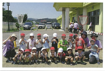
最後はメダルをかけて ハイポーズ (3才児)