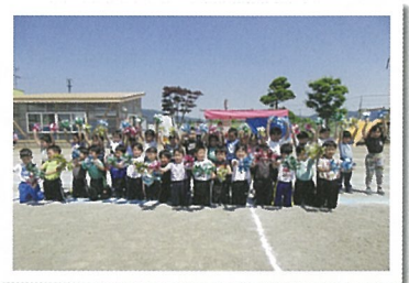
おゆづぎ・組体操 (4・5才児)