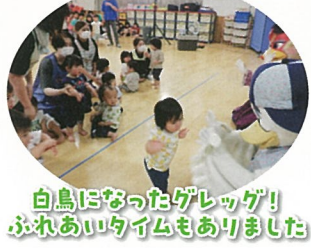
白鳥になったゲレック! ふれあいう時間もありません