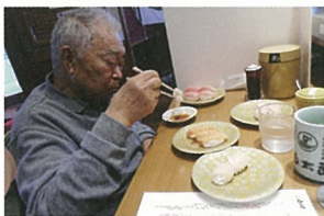
いっぱい食べました