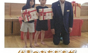
代表のお友だちが 受け取ってくれました