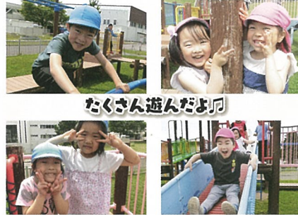
たくさん遊んだよ!