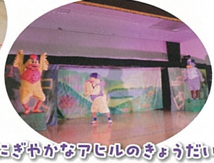
にぎやかなアヒルのきょうだい