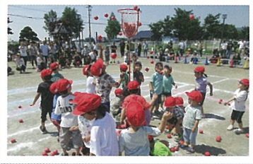
紅白玉入れ (3・4・5才児) いくつはいるかな