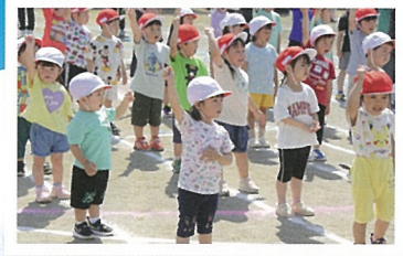
みんなでがんばるぞー (体操)