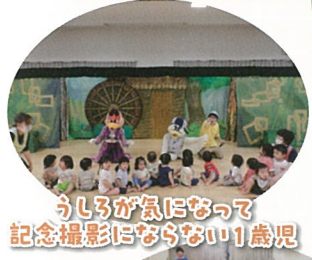
うしろが気になるって 記念撮影にならないう1歳児

MCのお兄さんが登場し、楽しいトークと手遊び、歌で期待感を高めてくれます。物語が始まると、大きな人形の登場に驚く子もいましたが、すぐにお話の世界に引き込まれていきました。