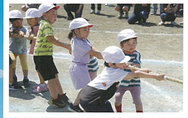
紅白綱引き (4・5才児)