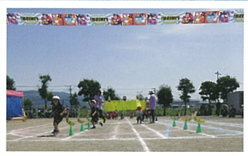
ゴールを目指して! (3才児)