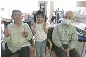
かわいくてひ孫みたいですネ