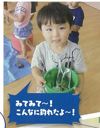
みてみて~! こんなに釣れたよ~!

3才児 すずらん組の 子ども達は日頃から生き 物や植物などの図鑑を見 るのが大好きなんだって! 今回はいろいろな種類 の魚の写真を使って釣りを 楽しんだんだよ!!