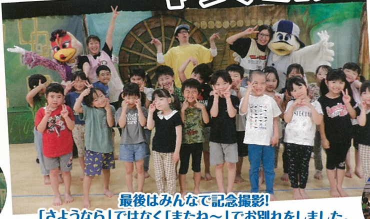
最後はみんなで記念撮影! 「さようなら」ではなく「またね~」でお別れをしました。

MCのお兄さんが登場し、楽しいトークと手遊び、歌で期待感を高めてくれます。物語が始まると、大きな人形の登場に驚く子もいましたが、すぐにお話の世界に引き込まれていきました。