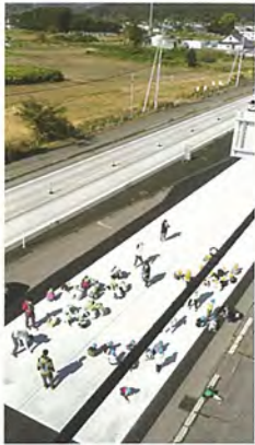
みんなが見えるよ

子ども達にとつていい思い出となりました。 子ども達にできる、とても貴重な時間を過ごすことが出来ました。