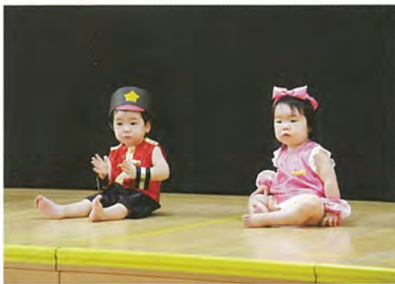
「おもちゃのチャチャチャ」