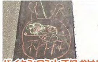
ハイキマン上手にかけた