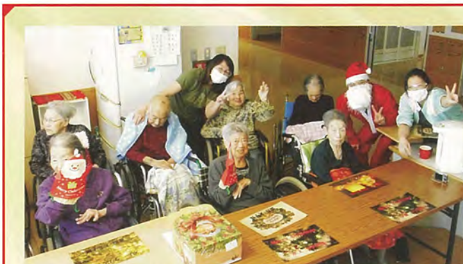
「特養クリスマス昼食会」