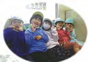
「いさりび鉄道」の窓から見える海や函館山はとてきれいでした!