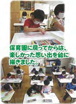
保育園に戻ってからは、楽しかった思い出を絵に描きました。

年長児くじら組が修園旅行へ行ってきました。今年のテーマは「新幹線」ですが、北斗市にはいさりび鉄道も通っています。そこで、二つの乗り物の魅力に迫るべく、上磯駅から木古内駅までは、「いさりび鉄道」、木古内駅から新函館北斗駅までは「新幹線」に乗ってきました。 新函館北斗駅では、北斗市にゆかりの深い「赤とんぼ」も歌ってきました。