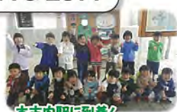
木古内駅に到着! これから新幹線に乗ります! 楽しみ~~~~