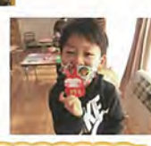
じょうずに切り貼りしています