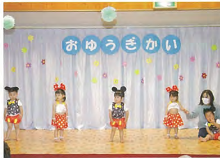
「ミッキーマウスマーチ」