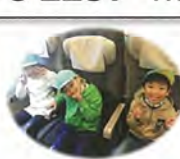
新幹線ですごく速い! 窓の景色が流れていくよ!