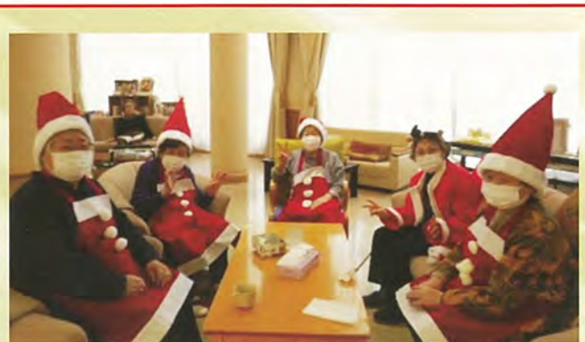
「デイサービスセンタークリスマス会」