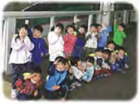
「いさりび」とパチリ