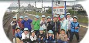
上磯駅から「いさりび鉄道」に乗って木古内駅へ…ワクワクしてます

年長児くじら組が修園旅行へ行ってきました。今年のテーマは「新幹線」ですが、北斗市にはいさりび鉄道も通っています。そこで、二つの乗り物の魅力に迫るべく、上磯駅から木古内駅までは、「いさりび鉄道」、木古内駅から新函館北斗駅までは「新幹線」に乗ってきました。 新函館北斗駅では、北斗市にゆかりの深い「赤とんぼ」も歌ってきました。