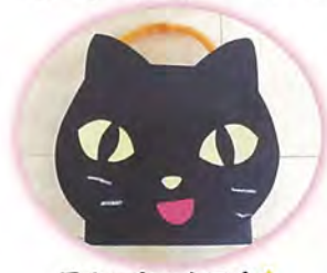
黒ネコちゃんです☆

それをティッシュ箱に貼ったら完成! かわいいバックが出来ました。 その後はおやつすくいゲームや紐くじをしてからハロウィンの衣装を着てパチリ!