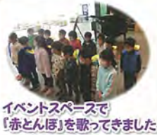
イベントスペースで「赤とんぼ」を歌ってきました