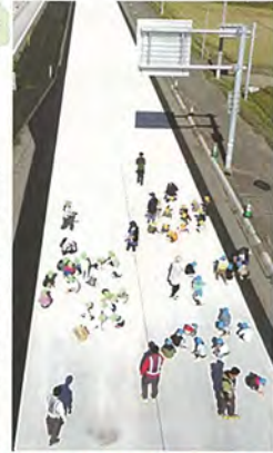
きれいな道路です

お絵かき当日はお天気にも恵まれ、広い道路に色々な色のチョークを持ち自由に思う存分お絵かきを楽しみました。 目 ドローンでの上空からの撮影もして頂き、なかなか体験できないことができ、とても貴重な時間を過ごすことが出来ました。