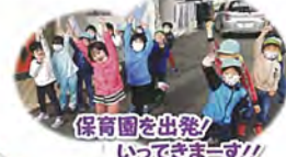
保育園を出発! いってきますー!!