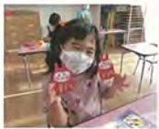
完成まであと少し