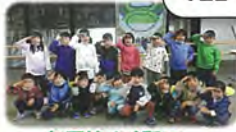
新函館北斗駅に到着!!