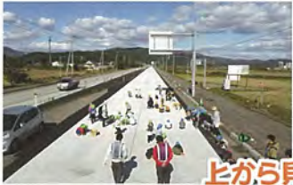
上から見えるかな