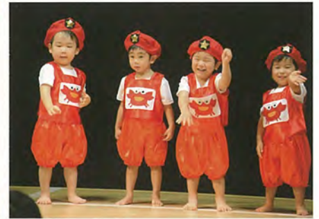
「カニさんのパトロール」