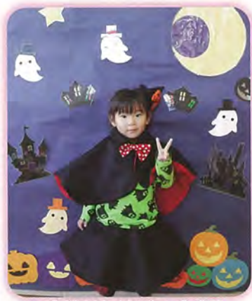
衣装がよく似合います♡

黒ネコバックはしばらくの間、お家に飾って置いていました。 トリック・オア・トリート!!