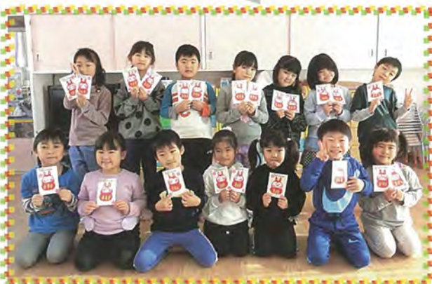
おじいちゃんおばあちゃんよろこんでくれたかな?

毎年、年長児が祖父母の方々を心にかけて年賀状作りをしています。今年は卯年ということで、担任から干支についてのお話を聞いた後、だるまに見立てたうさぎ作りに挑戦しました。はさみを使ってさまざまな形に切って貼り合わせ、顔をクレヨンで描き、最後に自分の名前を書いて完成です。後日、完成した年賀状をみんなでポストに投函しに行ってきました。子ども達は大好きな祖父母の方々のお顔を思い浮かべながら楽しそうに取り組んでいました。