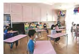
干支のお話を聞いています