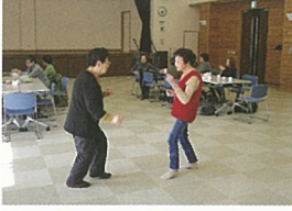
カラオケ横でダンスも開始!!