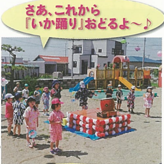
さあ、これから 『いか踊り』おどるよ~♪