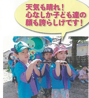
天気も晴れ! 心なしか子ども達の 顔も誇らしげです!