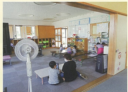
みんなで考えよう