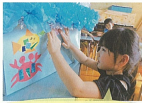
よいしょっ! はがれない ようにしっかりおさえて~!