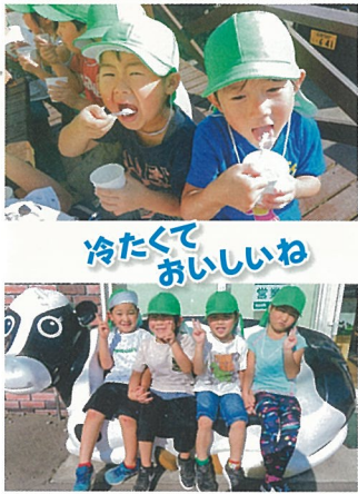
冷たくて おいしいね

まずはみんなで鈴木牛乳まで散歩をしながらソフトクリームを食べに行きました。暑い中頑張って歩いた子ども達も冷たくて、おいしいソフトクリームに満面の笑みでした。