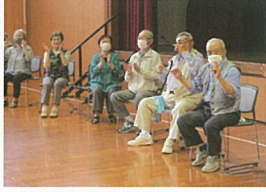
みんなで一緒に体操です