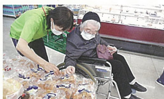
《生協へお買い物へ出かけました》