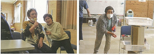
カラオケでデュエット?

今年度は新型コロナウイルス感染防止の為、手指や物品の消毒には普段以上の注意を払い、利用者様が安心して安全な活動を楽しんで頂ける様、職員一同努めています。御一緒に楽しい時間を過ごしてみませんか。新規ご利用を御待ちしております。