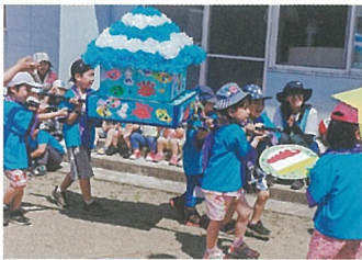
ワッショイ ワッショイ おみこし パレード 楽しいね!

年長児ひまわり組が中心となっておみこしを作り、園庭をパレードしました。小さなクラスのお友達も沢山応援してくれたので、とっても嬉しそうでした。その後は子ども達の太鼓に合わせて、みんなで『いか踊り』を踊り、楽しい一日となりました。