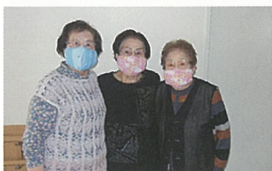
感染予防はしっかり! (センターで手作りのマスクです)

六月からは安全対策をしっかりと行いつつ、少人数でのお買い物や昼食会を実施しております。