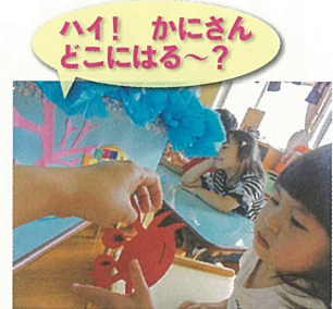
ハイ! かにさん どこにはる~?