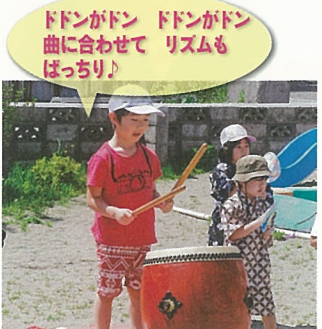
ドドンガドン ドドンガドン 曲に合わせて リズムも ばっちり!