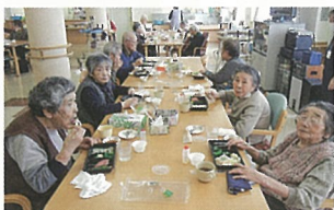
皆で食べるとおいしいね! (海鮮丸出前)