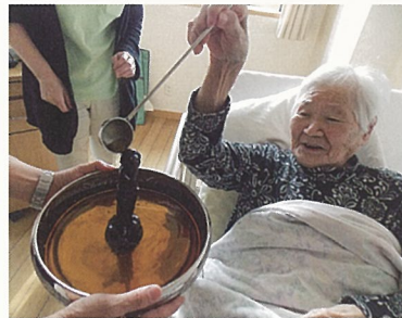
4月8日は花祭り。お釈迦様に 甘茶をかけ、手を合わせます。