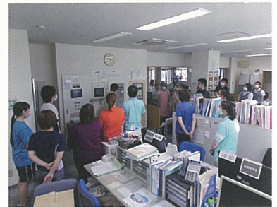
年に2度の避難訓練の時には、 防災機器の指導も受けます。