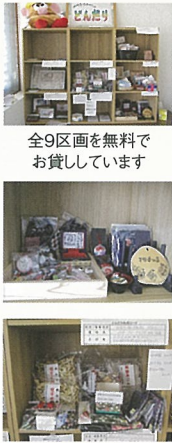
全9区画を無料で お貸しています

また、この活動再開に併せて、サロン参加者と地域の方の繋がりを作るべく、新しいコーナーをオープンさせました。その名も「地域交流スペースどんだり」です。