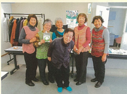
お誕生会の様子です。美女揃いでしょ！

早期の新型コロナウイルスの早期終息を願うとともに、引き続き当法人に対し変わらぬご理解、ご協力、ご指導をお願いします。