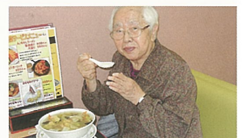
《中華ジャンジャンでお食事しました》

十月まで外出行事が続きますので、新型コロナウイルス感染症予防に努めながら、利用者様に楽しんでいただける行事をこれからも企画していきたいと思えます。