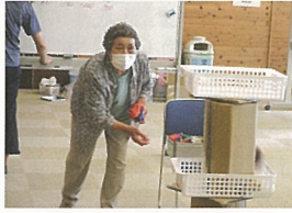
ゲームのひとつコマ(真剣勝負!!)