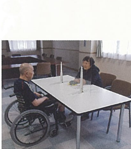
飛沫感染対策の為 アクリル板越しに面会