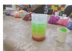
ろうソクで内部をコーティングします

今回のテーマは「うろこ模様の様な波々デザインを、様々な色を使ってカラフルに描く」でした。