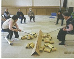
ゲームは白熱します