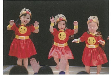
「アンパンマンたいそう」