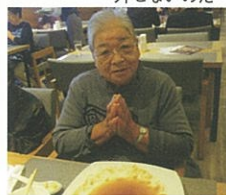
でも完食～ごちそうさまでした