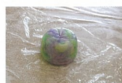
おまけのミニキャンドル