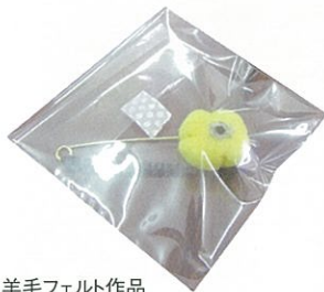
羊毛フェルト作品

サロンで一緒に活動をして頂けるボランティア・講師を募集しております。趣味や特技を披露したいと考えている方は大歓迎です。よろしくお願い致します。