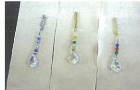
それぞれに個性が出ていて素敵ですね☆

同じ人でも、その日の気分ですべて違う色合いの物が出来上がるそうです。又、色にはそれぞれ意味がある様で、先生の説明を共感しながら真剣に聞いていたお母さん達でした。