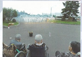
園での花火大会を行っています。もう少し暗ければ、もっときれいなのかなあ