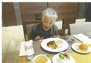
笑顔がこぼれます