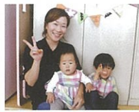
少してれてハイポーズ!

色を塗ったり顔を描いたら今度はお母さんたちの出番!ひもに旗を付けたら完成!ガーランドの出来上がりです。