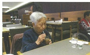
と、思いきや？食後のコーヒーは外せないのだ