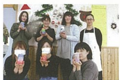
みなさんとても素敵です♡

その後はサプライズ!固まって使えなくなったろうソクを砕いて丸めると、ミニキャンドルの出来上がり。講師の先生と来年度の約束をして、この講習会を終えました。お母さん達はとても満足して帰られました。