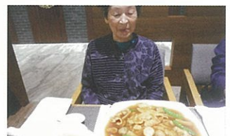
量の多さにビックリ