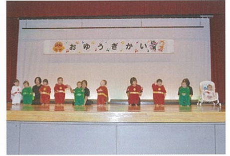
「アンパンマンマーチ」