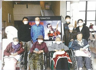
今年も文化祭に参加させて頂きました。たくさん作品を拝見し、楽しませて頂きました。