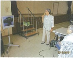
プロ顔負けの歌唱力

介護予防の主な活動としては、各種体操(基礎体操・頭の体操・音楽を使った体操等)・レクリエーション・趣味活動(ドライブ外出(観光各所巡り・ショッピング・お花見外出・紅葉外出等)・仲間との談話、そして、初の試みとして、カラオケを行いました。様々な活動を通じて利用者様が、「キラッと光る」生きがいを見つけて、日々の生活が生き生きと充実し、尚且つ、笑顔が絶えない様、お手伝いをさせて頂いております。