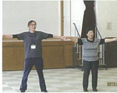
新しい漫才コンビ誕生