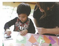
こっちに貼ろうかな?

色を塗ったり顔を描いたら今度はお母さんたちの出番!ひもに旗を付けたら完成!ガーランドの出来上がりです。