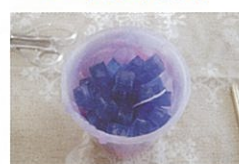
固形のろうソクを詰めます

融けたろうソクに好きな色の顔料を溶かして色を付け、容器の中に入れて流し込んで波状の模様をつけていきます。最後まで色を付けたら次は固形のろうソクを詰めていきます。