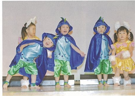
「ようこそジャパリパークへ」