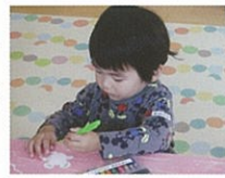
何色にしようかな?

10月24日(木)ハロウィン製作を親子で行いました。ハロウィンカラーのガーランドに、おばけやこウもりを貼りました。