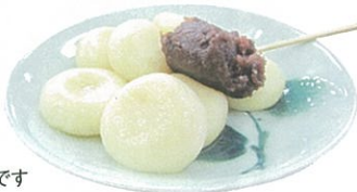
豆腐入り白玉です