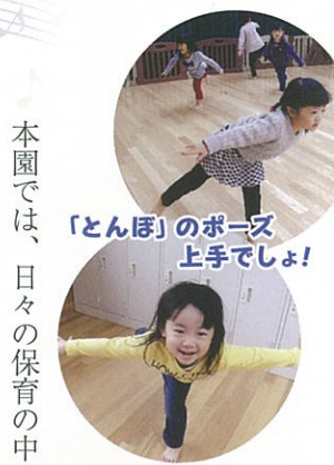
「とんぼ」のポーズ上手でしょ!

本園では、日々の保育の中に『リズムあそび』を取り入れています。 ピアノに合わせて転がったり、ハイハイをしたり、ギャロップや片足立ち、ブリッジをしたり等、子どもの発達に必要な筋力を鍛える全身運動に繋がっています。 曲が聞こえてくると自然と身体が動き出し、未満児組も真似をして挑戦しています。 室内で過ごすことが増えて、ちなこの季節、全身を使って、楽しく取り組んで行きたいと思えます。