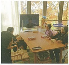
口腔体操も行っています。

清華園は広い建物の中に十か所のユニットがあり、約百名の皆様が入居されています。最近ようやく皆様の名前とユニット（お部屋）が分かるようになりました。現在は、歩行訓練、立位訓練、拘縮予防としての関節可動域運動やマッサージを中心に行なっています。機能訓練指導員としては未熟なところも多々ありますが、他職種とも連携協力し、また、入居者の皆様との触れ合いを通して日々精進していきたく思います。