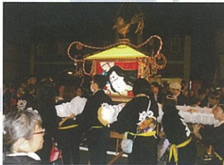
北斗市夏祭りに今年も神輿で参加。入居者の皆さんも見学に来てくれています。