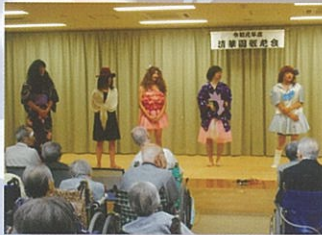
2階職員による女装コンテスト☆美人ぞろいです。誰が誰だか分かるかな？