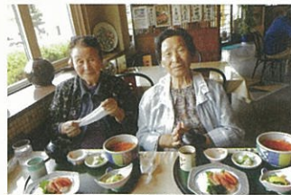
写真撮ってないで、食べよ!