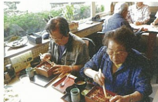
美味しいものは無言になります。