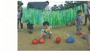
小さいクラスのお友だちも楽しそう！ 「ゲームだよ！いちごりんご、どっちにしよう？」