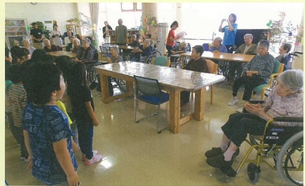
第四東光保育園交流会。七夕飾りを一緒に作り、最後に歌を聞かせてくれました。