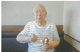
もちろん、デザートも!