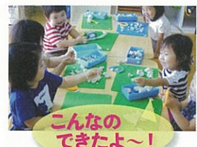
こんなのできたよ~!