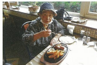
エビフライ好きなんだ～