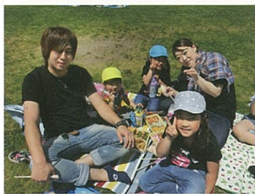
みんなで食べると美味しいね