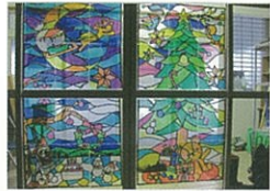
「クリスマス」クリスマス会へ向けて、壁飾りやステンドグラスを作成。当日はクリスマスケーキをデコレーションし、ビンゴ大会をして盛り上がりました。

その他の活動内容として、火曜日は第二から順に「形にとられない書道教室」「茶道教室」「ルフナの紅茶教室」、金曜日は第四に「たんぼぼとの共同開催」を定期で開催。偶数月の第1火曜日には「羊毛フェルト教室」を開催し、フリーの日には雑談や脳トレ、介護保険の話など遊ぶことから学ぶことまで色々行つていきます。その他、恒例行事として「クリスマス会」「新年会」「宝引き大会」も年1回開催し好評いただいています。まだまだ、空いている曜日がありますので、趣味や特技を持て余している方！サロンボランティアとして、又は講師として披露してみませんか？お仲間同士でも大歓迎です！是非一緒に盛り上がりましょう！