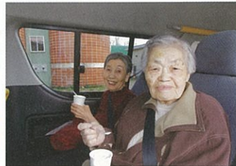
ドライブに行ってきました。桜も良かったですが、ソフトクリームも美味しかったです。