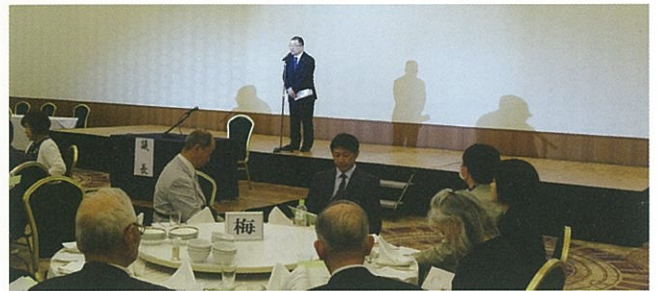
総会・懇親会のように