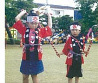
年長児さんが「おみこし」「ヨサコイ」で盛り上げてくれました！