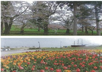
今年は4日間ドライブに行きました。桜もチューリップも満開で、とてもキレイでした。