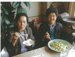
皆どのお食事、美味しいね。