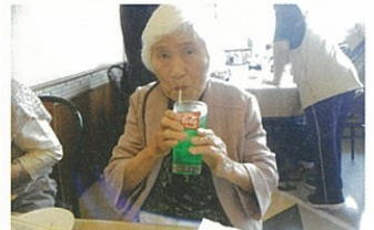
メロンソーダ!この味懐かしい…