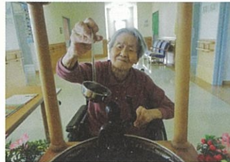
お釈迦様に甘茶をかけ、手を合わせています。