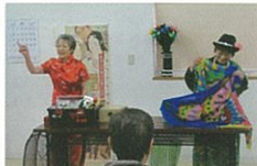
「マジギーなつこのマジックショー」笑いとおどろきの連続！ワン、ツー、スリー！とお尻をキュートに振るおまじないは、馴染みの光景となってきました。