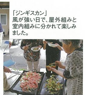
「ジンギスカン」風が強い日で、屋外組みと室内組みに分かれて楽しみました。