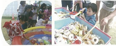
ヨーヨー釣りに菓子すくい、ジュースにポップコーン、千本引き、盛りだくさんです！