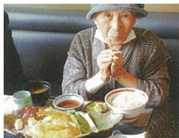
美味しそうだなーいただきます!