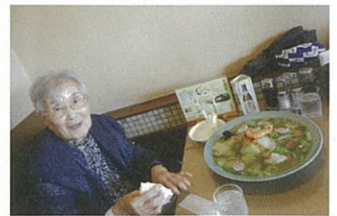
おっさくて、びっくり