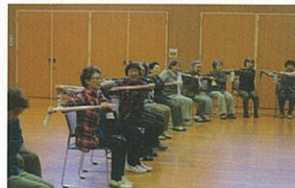
利用者様全員で元気に体操です。