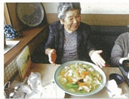
あんかけ焼きそば、こんなに大きいよ!!

外出する機会も減ってきている方が多いので、皆さん外出行事はとも楽しみにされています。