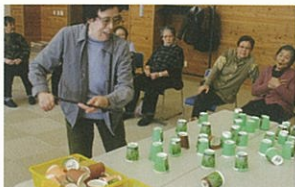
紙コップを茶葉に見立てて拾い集めるゲームです。