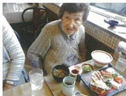
あんたも食べるかい?