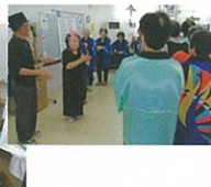
「二翁の会」芸達者な皆さん。にぎやかな炭坑節の輪踊りと、長寿の風を受けて参加者の健康を祈ります。