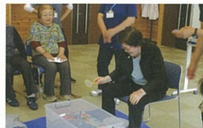
ゴム製の金魚を使い金魚すくいゲームをしました。金魚のお持ち帰りゲームです。