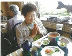
御馳走だ! 頂きます!