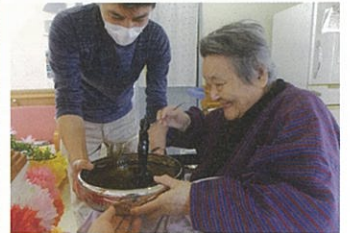
4月8日に花祭りを行いました。入居者の皆さんも、台車を飾るお花を作ってくれています。