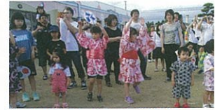
浴衣や甚平、とってもステキ。皆で盆踊りを楽しみました。アンパンマンが太鼓を叩いてくれました。

去る7月20日(土)、毎年恒例の「夏祭り」を行いました。手作りのおみこしを担いでのパレードや、よさこいを披露したりと年長さんが大活躍。お祭りの雰囲気を感じ上げてくれました。