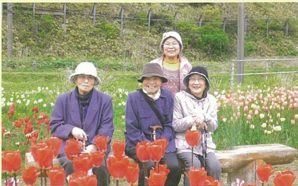
サラキ岬でチューリップを堪能

現在、社会福祉法人は、全国に約2万法人あり、働いている職員は87万人、利用者は約300万人にのぼります。今後、さらなる利用・希望対象者の増加が見込まれ、法人として福祉の向上に互いに支え合い、責任ある経営を進めて行かなければならないと考えております。今後とも当法人に対し変わらぬご理解、ご協力、ご指導をお願い致します。