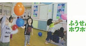
ふうせんホワホワ