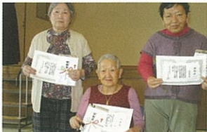
皆勤0賞・精勤賞おめでとうございます 記念品のがになります!!