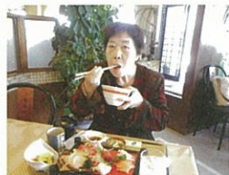
今日はたくさん食べれそう!