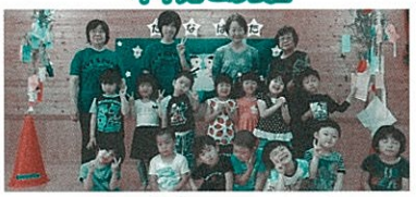
記念写真「ハイ!!チーズ!!」