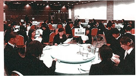
親睦会懇親会の様子