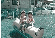
ラッコのクラクラおもしろいよ!