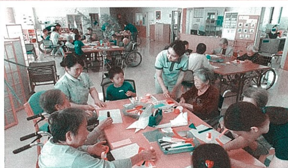
第四東光保育園交流会七夕製作