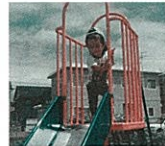
ちよっぴりドキドキ..