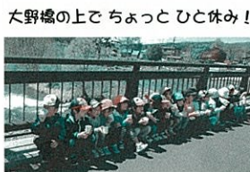
大野橋の上でちょっとひと休み! 保育園の近くの子どもの大好きな公園を紹介しまふ! 子ども達がつけた名前なので正式名所ではないところもあります! あしからず!