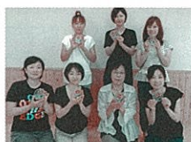
素敵なオリジナルコースター出来ました!

一時間程度で終わりましたが口数も少なく真剣に作っていたお母さんたちでした。「グラスアート」はコースターだけではなく鏡の枠やランプの笠・小物入れ等色々な物が出来るので来年はステップアップした物を作りたいですね!