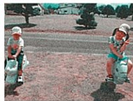
グラングランゆれておもしろいね!