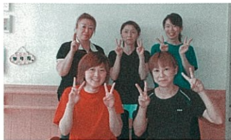
3Fりんどう・やまぶき 笑顔を忘れず、入居者の為に頑張ります！