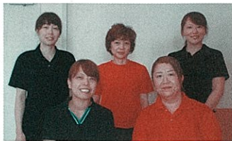
3Fむくげ 皆さんの毎日の笑顔大切にしていけます！