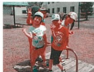
かも合わせてバランスとって!