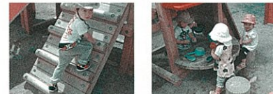
お天気が良い日はいつも遊んでいます!