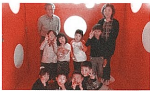
いただいたサイコロキャラメルを持って、ハイ・チーズ!!