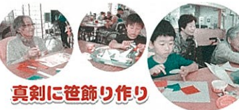
真剣に笹飾り作り

7月4日(月)には、保育園の祖父母の方々や年中児、年長児で協力して笹飾りを作りました。おじいちゃん、おばあちゃんに来ていただき子ども達は大喜び!!おやつも一緒に食べ、うれしくていつも以上ににぎやかな一日となりました。