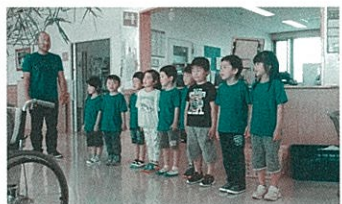
元気に挨拶 七夕の歌も唄ったよ

6月29日(水)に、年長児が清華園を訪問させていただき、いろいろな形の折り紙をつなげたり、わつなぎを作ったり楽しい時間を過ごしてきました。