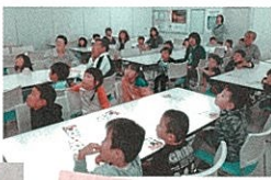
これがチョコになるの!?

まずは、キャラメルやチョコレートが出来るまでの工程をお勉強。実際の原料を見たり嗅いだり…。ホワイトチョコと普通のチョコの違いを教えるもつたりと興味津々に教えていただきました。