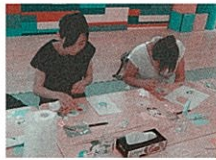
とても真剣なお母さんたち