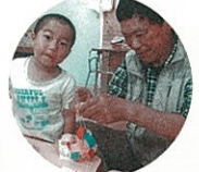
おじいちゃん、おばあちゃんと一緒に!!