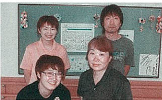
3Fこぶし・すずらん 入居者一人ひとりの思いを尊重し頑張ります！

前号から始まりました、各種紹介の第二弾となります。今回は介護職員（3F）をご紹介します。