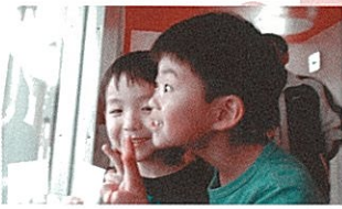
先生、こつち見てって言うけど、しかげが気になつて見れないよ