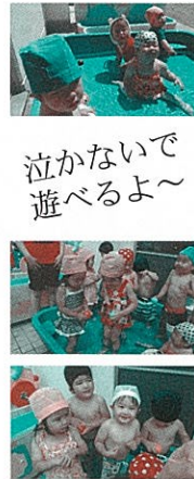
泣かないで遊べるよ～

7月5日にプール開きを行い、子ども達が楽しみにしていたプール遊びが今年も始まりました。