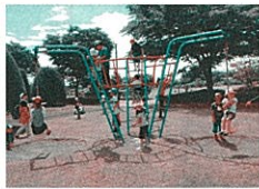
せせらぎ温泉前広場