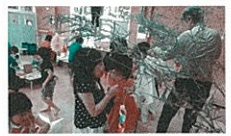
願い事がかないますように