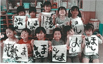
7月のお題「ほし」のひのひ表現しました。

三枚書いた後は自由に表現する時間です。心を落ち着かせ集中して書いた後の自由画の時間は格別の様です。「ただいま」と書道を終えて帰ってきた子ども達からは、「今日も楽しかった。」の声しか聞かれませんが、書道を楽しみながら文字への興味を深めたり、心豊か