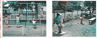
じゃんぐるじがみんなのお気に入り!